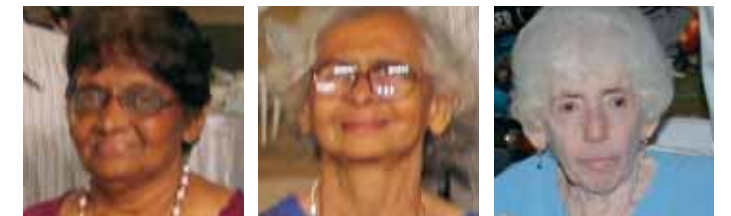
Légende des photos:

Je suis stupéfait de voir ce que toute notre structure d'anciens élèves a pu réaliser grâce à une action collective. Nos enseignants mènent leur vie sans bruit, avec dignité, et ils ne se sont jamais plaints du peu qu'ils ont reçu pendant la durée de leur service d'enseignants. Je suis vraiment enthousiasmé de voir qu'un petit effort de la part des ancien/nes élèves a si profondément influencé la vie de nos enseignants.