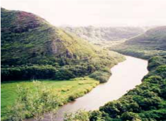
Une des rivières du Burundi