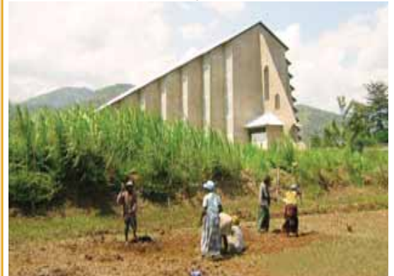
La Chapelle du Lycée du Saint Esprit