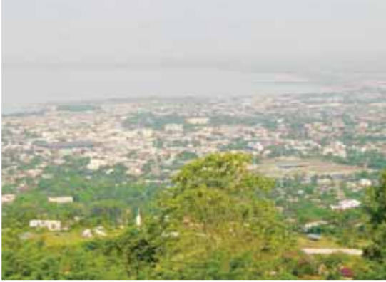
La ville de Bujumbura - Burundi