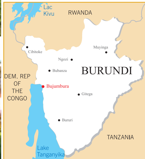
Bujumbura – emplacement géographique.

Organisé par l'Association Burundaise des anciens élèves des Jésuites avec le concours des anciens de la République Démocratique du Congo et du Rwanda