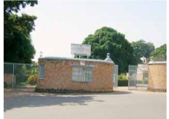
Porte d'entrée du Lycée du Saint Esprit