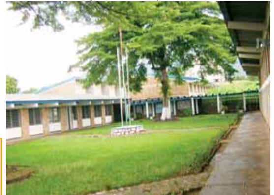
Une des cours intérieures du Lycée