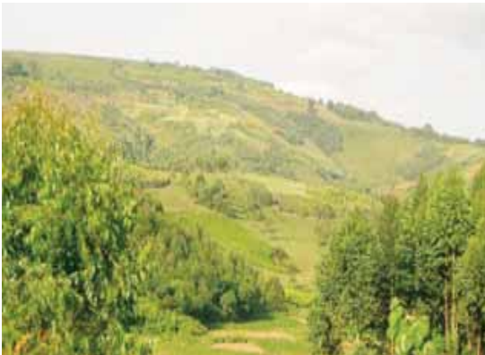
Paysage du Burundi, " le pays des mille collines"