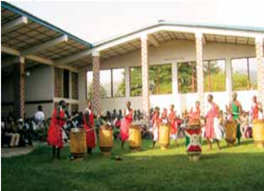
Un groupe d'élèves en train de danser – Lycée du Saint Esprit