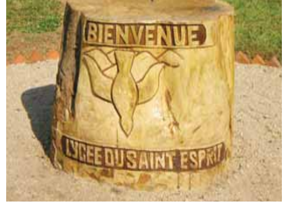
Sculpture en pierre avec le logo du Lycée