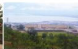
Site du Campus Kiriri (Ex-Collège du Saint-Esprit)