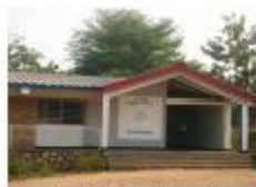
Lycée du Saint-Esprit Gihosha

Le Collège du Saint-Esprit a été fondé par les Jésuites en 1952 sur le site de Kiriri. Sa première promotion est sortie en 1958 avec 18 rhétoriciens. Il a été transféré à Gihosha en 1983 et s'est appelé Lycée du Saint-Esprit en reprenant son nom d'origine. En 2007, il avait 846 élèves dont 54% de filles. Depuis sa création, plus de 3400 diplômés en sont sortis. L'Association a été créée en 1991 et a été reconnue légalement en 2001.